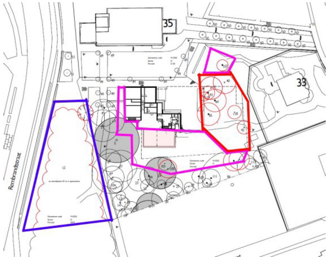
Figuur 2: geplande kapwerkzaamheden. De ontheffing ziet op het gedeelte binnen het rode kader. De bomen binnen de blauwe en paarse kaders zijn reeds gekapt. Dit geldt ook voor het zuidelijk deel van het sparrenbos, wat in bezit is van de gemeente (Van Meurs, 2021)