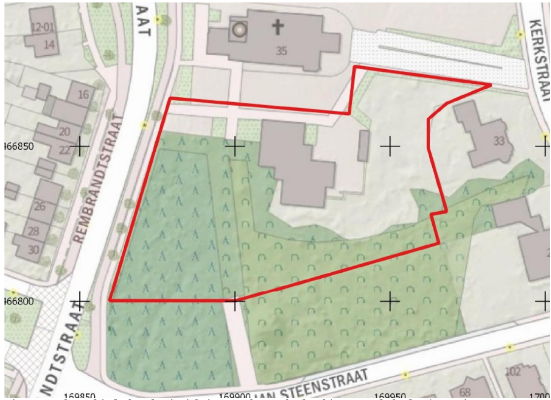
Figuur 1: Plangebied t.b.v. herinrichtingswerkzaamheden binnen rode kader (De Vries en Van Meurs, 2020)